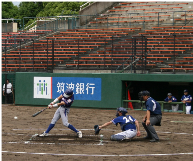
日立市職対県職連合の決勝戦

総合運動公園軟式球場で開かれた野球大会開会式には前年度優勝の日立市職と県南・県職・水戸・水郡・鹿行・県北ブロック代表6チームが参加。一回戦、二回戦は、各チームとも日頃の實力を發揮、この結果、決勝戦には日立市職と県職連合が勝ち進みました。水戸市見川総合運動公園市民球場で開かれた6月30日の決勝戦は、先攻が日立市職、後攻が県職連合。初回、両チームと